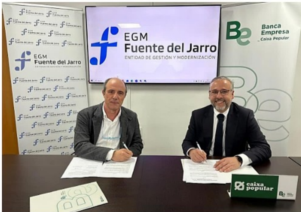
Firma del acuerdo entre la EGM Fuente del Jarro y Caixa Popular. (LP)

Guardar | Regala esta noticia | Añadir a favoritos | Añadir a Google