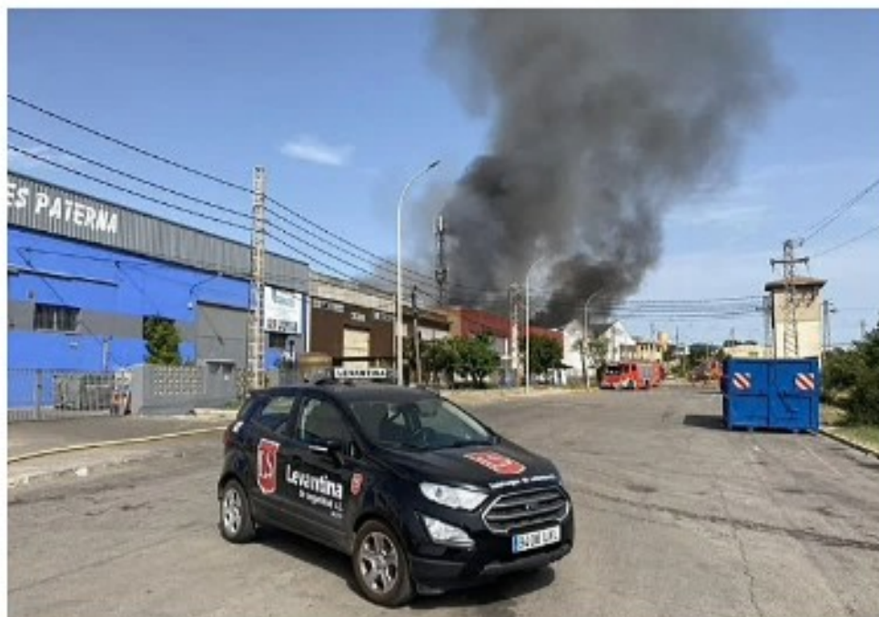
Vehículo de vigilancia en el polígono Fuente del Jarro.

Guardar | Regala esta noticia | WhatsApp | Facebook | X | Telegram | Añadir en Google