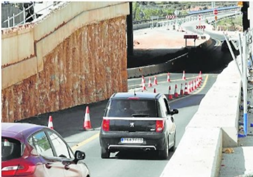
Obras en la carretera N-220. (Irene Mariñel)

Guardar | Regala esta noticia | WhatsApp | Facebook | X | Telegram | Añadir en Google