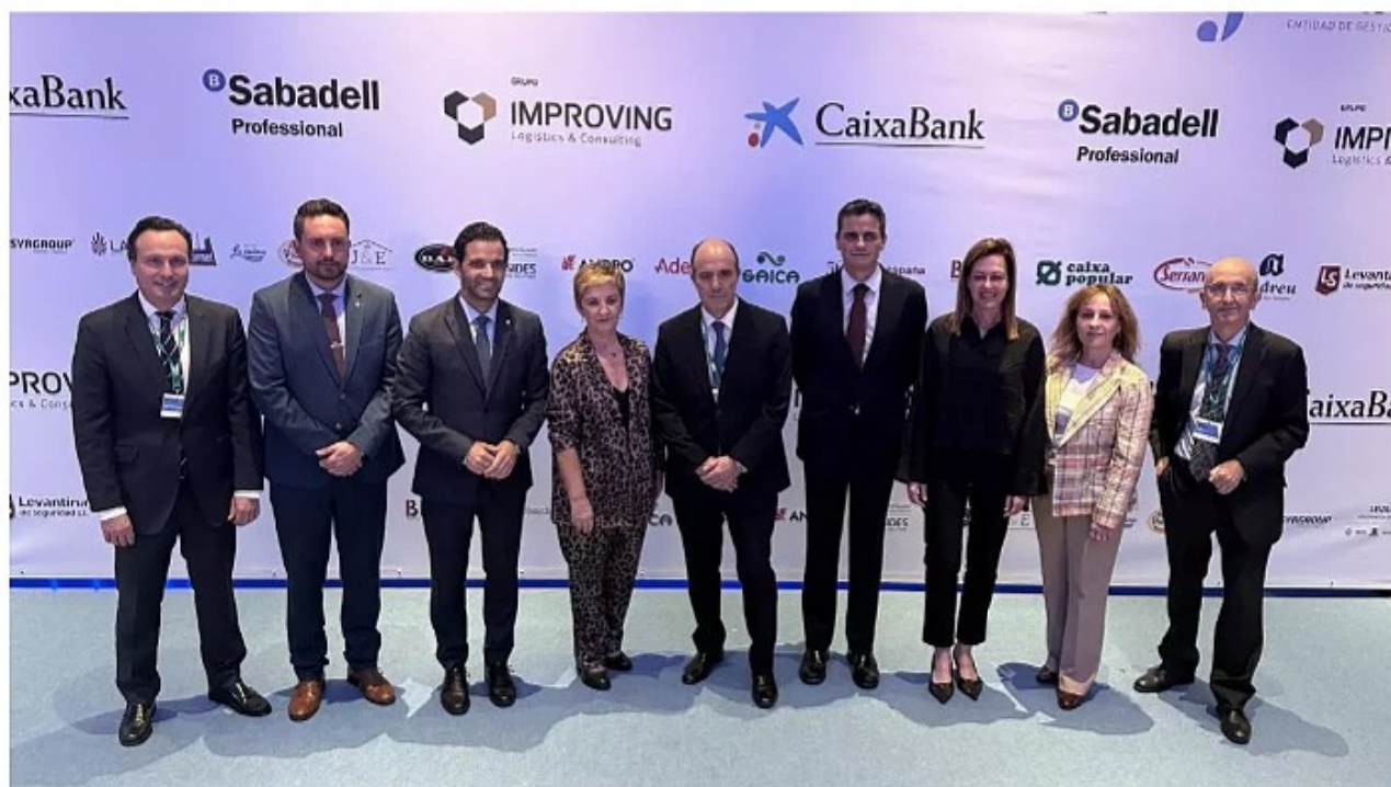
La consellera con el presidente de Fuente del Jarro y el resto de autoridades, antes de la gala