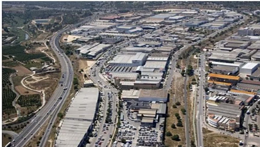
Imagen aérea del polígono Fuente del Jarro en Paterna

El acuerdo está dotado con 100.000 euros para el ejercicio 2025 y tiene como objetivo la reparación de aceras, la rehabilitación y acondicionamiento de la sede de la entidad, la renovación de la señalización vial horizontal y el aumento de papeleras y contenedores