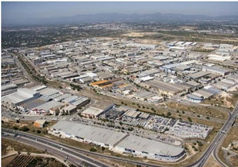
Imagen aérea del Polígono Fuente del Jarro.

Guardar | Regala esta noticia | WhatsApp | Facebook | X | Telegram | Print | Añadir en Google