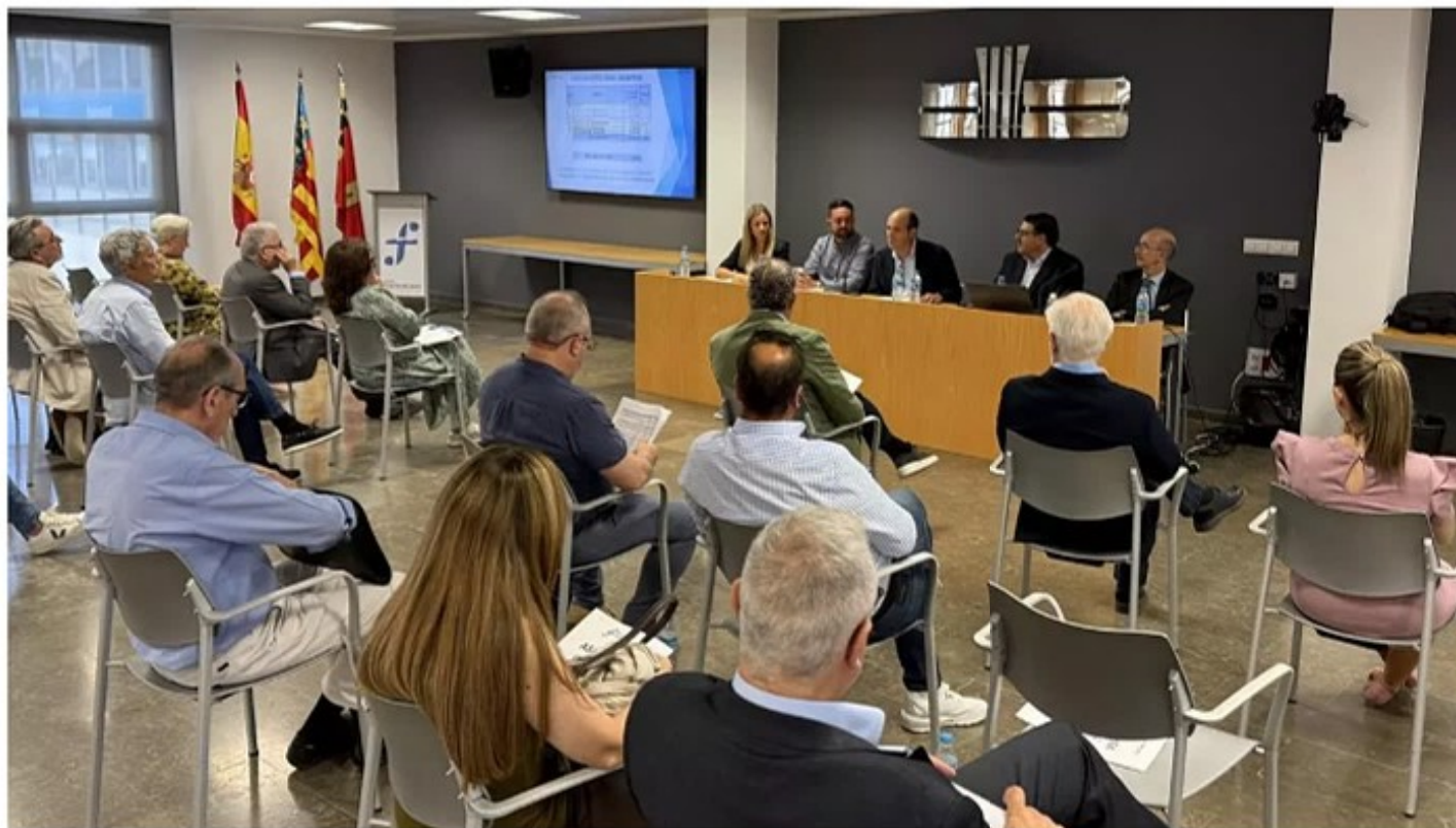
Asamblea General de Fuente del Jarro

La EGM anuncia la celebración de un nuevo encuentro empresarial a finales de año en el Roig Arena