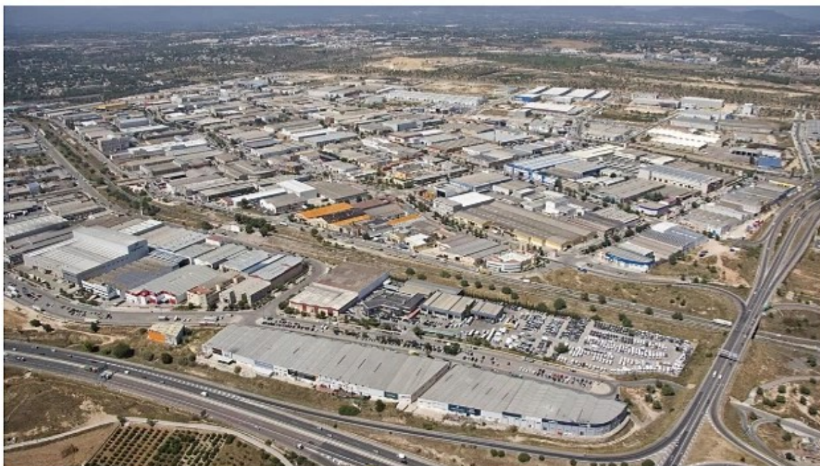
Imagen de archivo área empresarial Fuente del Jarro de Paterna

El consistorio, a través de las ayudas del Ivace y del presupuesto municipal, mejorará la recogida de aguas pluviales en Fuente del Jarro, ejecutará la segunda fase del Bulevar Pla de Pou y adecuará solares municipales para aparcamientos públicos